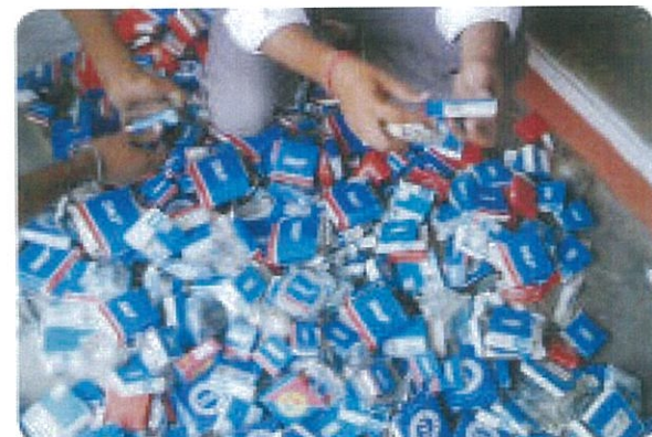
Bearing-bearing palsu disita saat penggeledahan polisi.