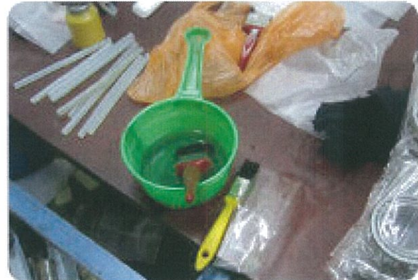
Peralatan yang digunakan di workshop pemalsuan.

Bukannya mendapatkan produk berkualitas tinggi, pada akhirnya anda membeli produk dengan kualitas rendah dengan harga yang lebih mahal dari sepatasnya.