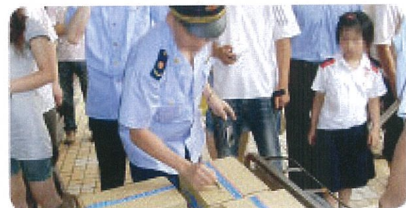
Pengeledahan oleh polisi, pada saat bukti-bukti cukup diterima.